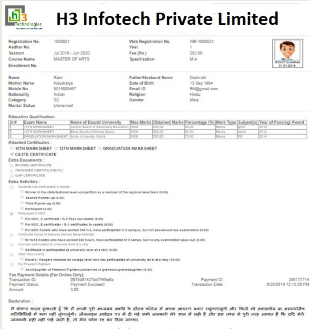
Figure 8 (आकृति 8)

(कृपया नीचे डैशबोर्ड पर एक नज़र डालें चित्र 9)